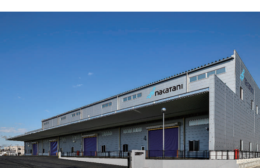
中谷興運倉敷水島物流センター

好調な物流、ライフケア事業 ―健康経営に取り組みられています。調を維持できたことで、トータルで増収増益を達成することができました。ダイバーシティー(人材の多様性)の推進にも積極的です。 ―「男女共同参画推進事業所」の認定を受けました。知的障害などのハンディキャップを持つ方や外国人、シニアも積極的に採用しています。昨年はベトナム人技術者を採用し、今春は支援学校からインターンとして受け入れた2人のうち1人が内定。多様な人材を活用することで、お客さまのニーズに対応できる体制をつくり、地域にも貢献できればと考えています。 ―健康経営に取り組みられています。―3カ年計画最後の年となりました。今期以降については、どのような展望や方針をお持ちですか。 ―これまでの従業員やその家族の健康づくりに積極的に取り組んできました。最近の米中貿易問題、東南アジア情勢などの影響に鑑みて、2020年度期は楽観視できないと考えています。最終年は生産性の向上、仕事の効率化、新技術の検討などに取り組むことで、強い社内体質づくりに努めたい。また、諸外国の成長の源泉を取り入れるべく、社員を東南アジアへ派遣して調査・研究を深め、海外でのビジネスチャンスをつかめればと構想しています。 ―健康経営に取り組みられています。―3カ年計画最後の年となりました。今期以降については、どのような展望や方針をお持ちですか。 ―これまでの従業員やその家族の健康づくりに積極的に取り組んできました。最近の米中貿易問題、東南アジア情勢などの影響に鑑みて、2020年度期は楽観視できないと考えています。最終年は生産性の向上、仕事の効率化、新技術の検討などに取り組むことで、強い社内体質づくりに努めたい。また、諸外国の成長の源泉を取り入れるべく、社員を東南アジアへ派遣して調査・研究を深め、海外でのビジネスチャンスをつかめればと構想しています。